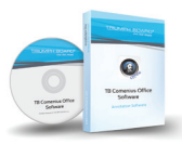
TB Comenius Office